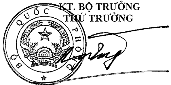
Thượng tướng Bế Xuân Trường