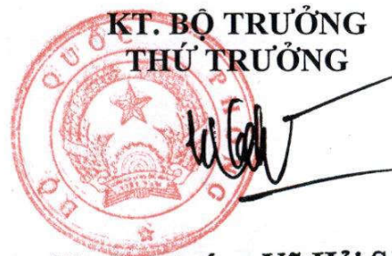
Thượng tướng Vũ Hải Sản